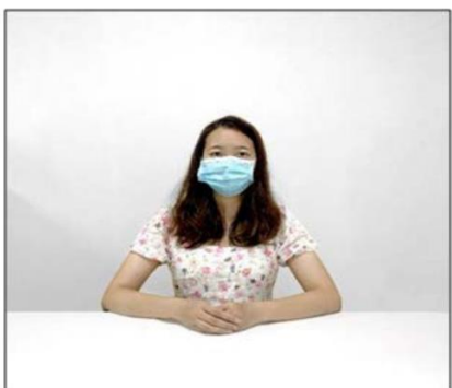
图2：正前方第一机位效果图